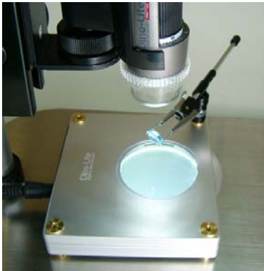
360 度偏光轉盤 輕易調整背景光源