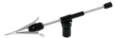
可另購珠寶專用夾 方便夾取珠寶物件