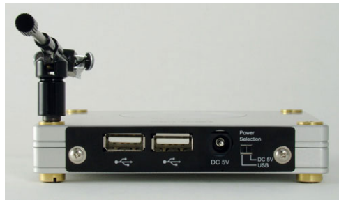
穩固的平台設計 可切換電源供電